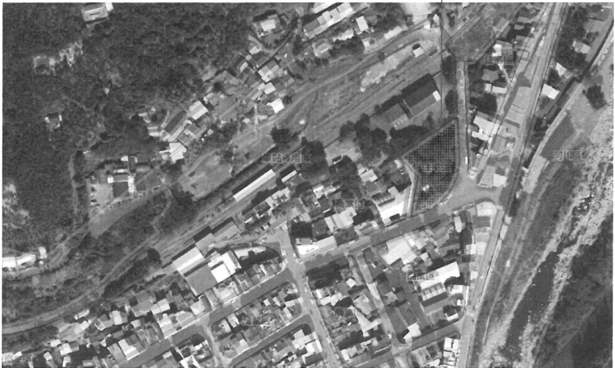
圖 1-4 基地現況環境 (基地現況詳如附件 9)

地點：南投縣水里鄉水里段 136、137、137-1、138、138-1 地號 (國有地，都市計畫計內，住宅區)