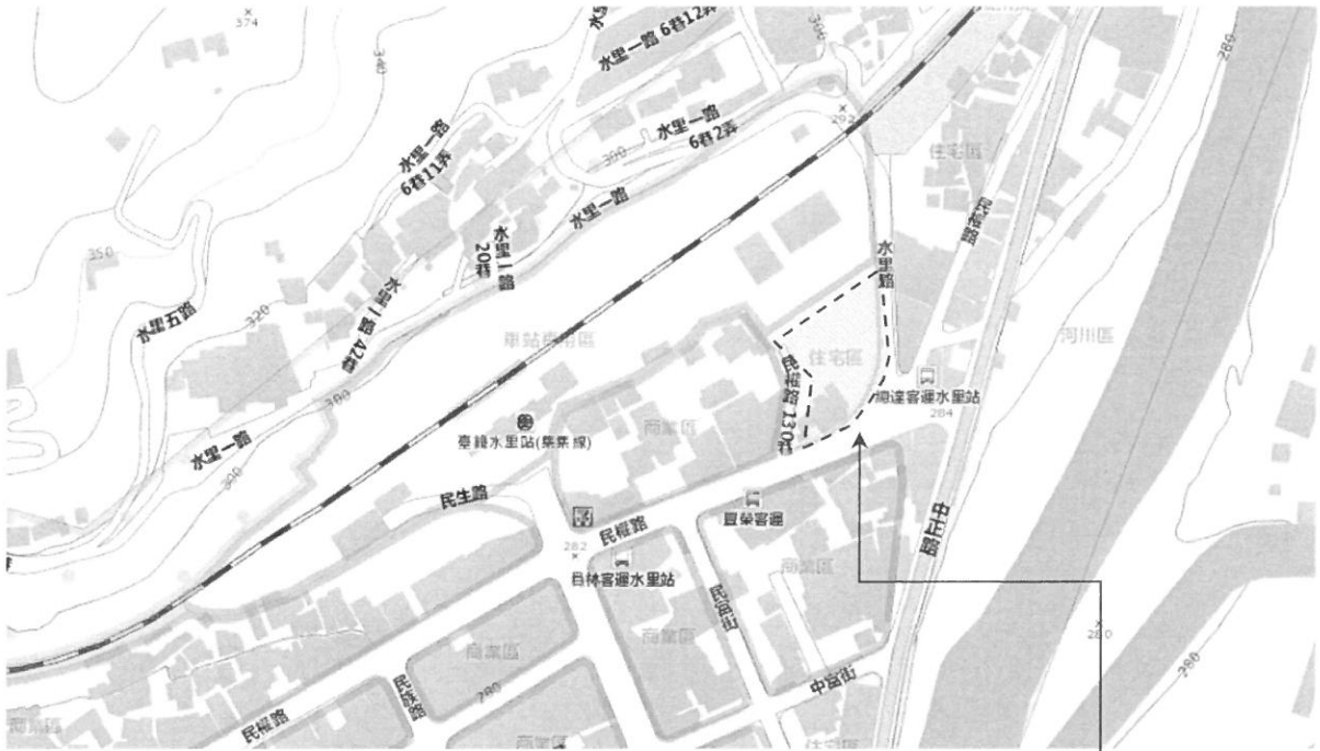
圖 1-3 基地位置圖

地點：南投縣水里鄉水里段 136、137、137-1、138、138-1 地號 (國有地，都市計畫計內，住宅區)