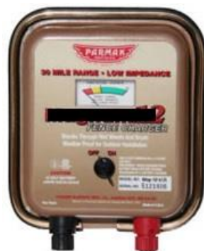
圖二：(直流電) 電牧器(供電電源：DC12V 或 12 電池；最大能量傳輸距離 20 公里；輸出電壓：11KV；脈衝週期時脈衝電流：110mA 或 180mA；使用注意事項：(1)須安裝接地線(避免雷擊損毀)；(2)接電時應做好導線絕緣措施；(3)使用電壓檢測器量測電瓶電壓；(4)不可直接置於戶外任風吹雨淋；(5)農地較不適合使用太陽能型電牧器；(6)要經常巡查有無異物在電牧導線上避免漏電。)